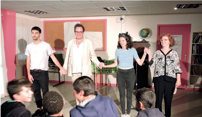
Les comédiens des Pieds dans l'Eau ont proposé une étonnante lecture théâtralisée

Publié le 3 octobre 2022 par Laurent Torral